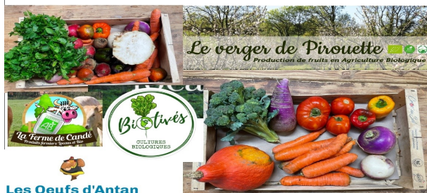
Les Oeufs d'Antan